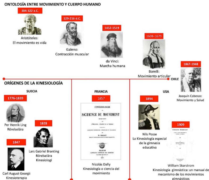
Fig. 1. Síntesis de la Ontología del movimiento y el cuerpo humano.