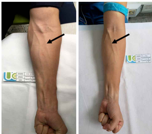
Fig. 2. Venas cefálicas que terminan en la vena basílica.

En el miembro superior derecho se presentó una vena cefálica en 171 casos, (85,5 %), dos venas cefálicas en 27 casos (13,5 %) y tres venas cefálicas en 2 casos (1 %), (Tabla III). En el miembro superior izquierdo se presentó una vena cefálica en 170 casos (85 %), dos venas cefálicas en 26 casos (13 %) y tres venas cefálicas en 4 casos (2 %), (Tabla IV).